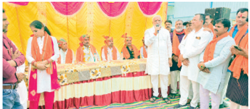
हरिभूमि न्यूज़ ▶▶ गुरावर